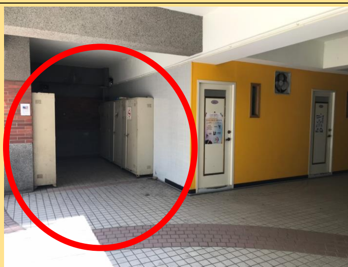
1. 掃具放置處(至誠樓 B1 丹古咖啡屋斜對面)