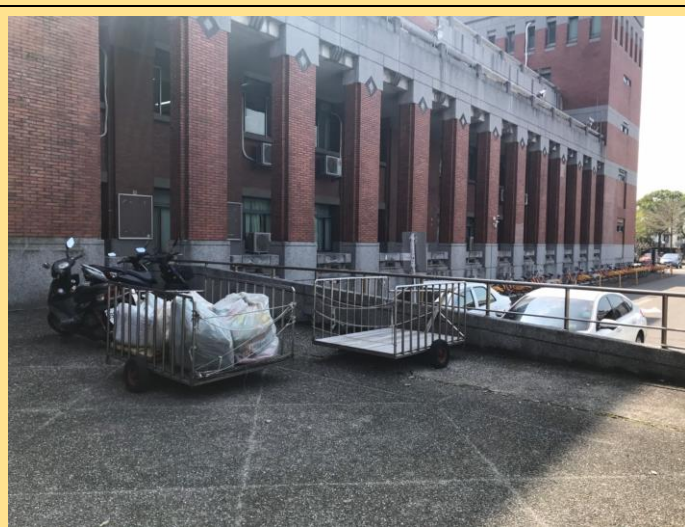
2. 垃圾放置處(陽光大道車道入口旁之拖板車上)